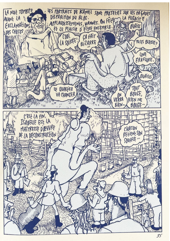
Extrait de la BD «Rio Chamiers» de JM Bertoyas, éditions Ouïe/Dire