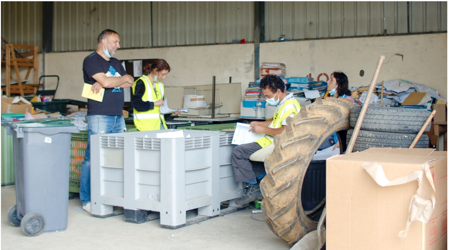
Photogramme tiré du film

Compagnie Ouïe/Dire - 3, rue de Varsovie 24000 Périgueux - 05 53 07 09 48 - contact@ouiedire.com Kamel Maad : kamel.maad@me.com Colas Bertin (JM Bertoyas) : jm.bertoyas@gmail.com