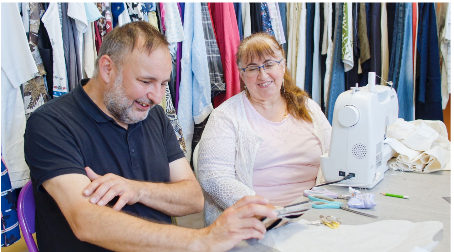
Photogramme tiré du film

On découvre aussi la particularité de cette résidence artistique, dont le dessinateur et le réalisateur font partie, creuset d'expérimentations et de collaborations entre différentes formes d'arts qui témoignent de la violente mutation de ce quartier où l'immeuble emblématique est voué à une destruction aussi réelle que symbolique.