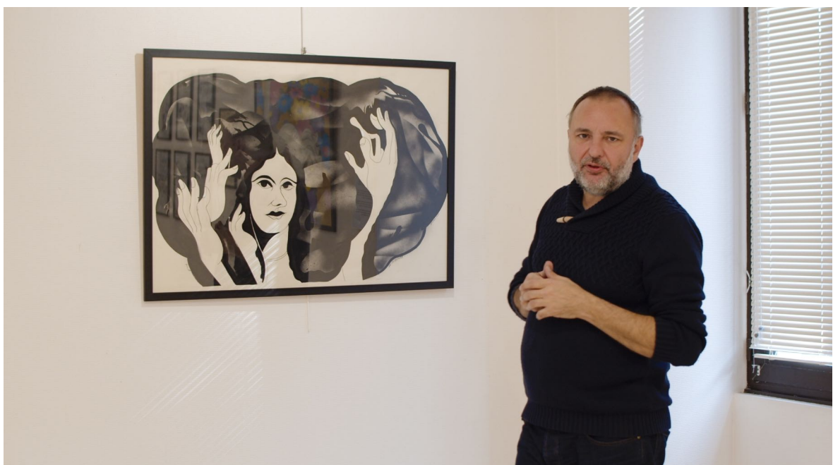
Photogrammes tirés du film